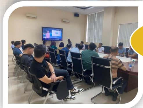
Hội Tin học TP. Hồ Chí Minh