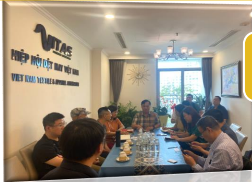
Hiệp hội Dệt May Việt Nam - Vitas