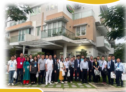
Công ty Phân bón Bình Điền